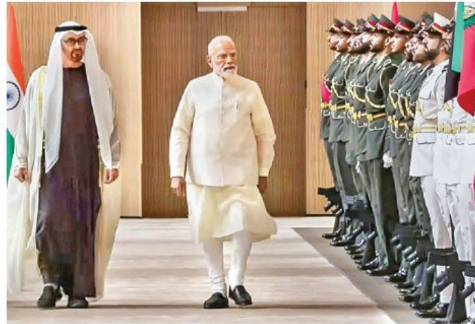
पश्चिम एशिया में तनाव के बीच यूएई के साथ मिलकर अपनी ऊर्जा आपूर्ति लाइन को सुरक्षित करता भारत।

प्रधानमंत्री नरेंद्र मोदी की पांच देशों की यात्रा ने अंतरराष्ट्रीय निवेशकों के बीच भारत को लेकर एक अभूतपूर्व विश्वास पैदा किया है। आज जब वैश्विक बाजार में अनिश्चितता और मंदी का माहौल है, निवेशक अव्यधिक सतर्क हैं और पूंजी सुरक्षित स्थानों की तलाश में है, तब भारत विदेशी प्रत्यक्ष निवेश (एफडीआई) को आकर्षित करने में सफल रहा है। ज्ञात हो कि विदेशी प्रत्यक्ष निवेश केवल धन नहीं लाता, यह बिना ब्याज की ऐसी पूंजी है, जो देश में आधुनिक तकनीक लाती है, विदेशी मुद्रा पंजर को मजबूत करती है और बड़े पैमाने पर रोजगार के नए अवसरों का सृजन करती है।