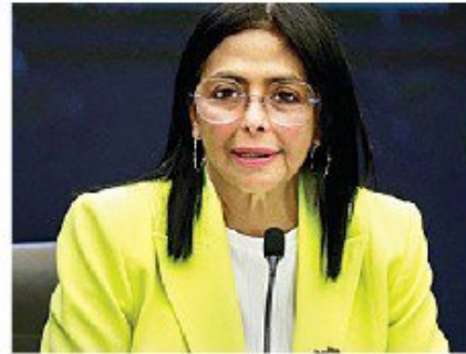
डेलसी एलोइना रोड्रिगुएज गोम्स। फाइल

वेनेजुएला की अंतरिम राष्ट्रपति डेलसी एलोइना रोड्रिगुएज गोम्स 3 से 7 जून 2026 तक भारत की आधिकारिक यात्रा पर आ रही हैं। पहले वे एक जून को इंटरनेशनल बिग कैट एलायंस समिट में शामिल होने वाली थीं, लेकिन समिट टल जाने के कारण यह यात्रा कार्यकारी रूप में हो रही है। रोड्रिगुएज गोम्स विदेश मंत्री, अर्थव्यवस्था एवं वित्त, विज्ञान एवं प्रौद्योगिकी, संचार एवं सूचना तथा परिवहन मंत्रियों के साथ आ रही हैं, जो बताता है कि भारत के साथ संबंधों को आगे बढ़ाने के लिए वह बेहद गंभीर हैं। वैसे यह उनकी छठी भारत