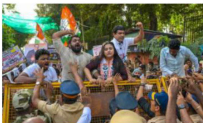
Youth Congress members protest seeking the resignation of the Union Education Minister in Mumbai on Tuesday.